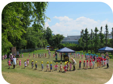
おまつりひろば、楽しかったね