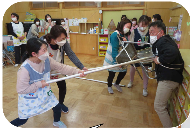
不審者対応訓練 さすまたの使い方を 習いました